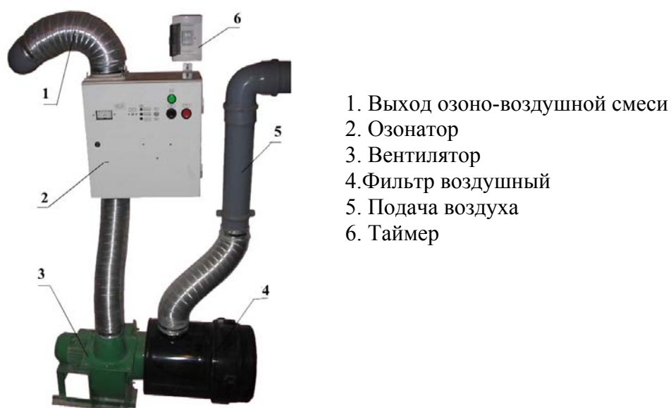
Рис. 1. Система озонирования СО – 10.

Известно, что озон хорошо адсорбируется и в адсорбированном состоянии сохранность его увеличивается до десятков суток. В птичнике время между обработкой корма и его потреблением составляет десятки минут, поэтому куры озон потребляют с кормом.